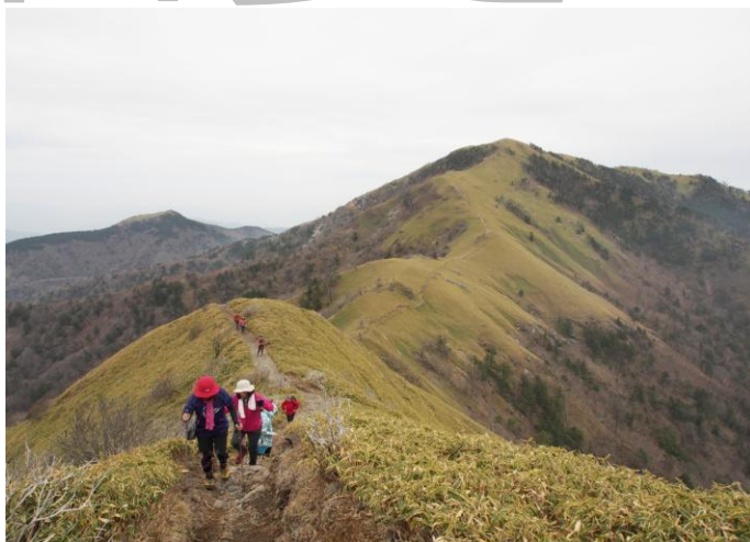
▲ 剣山を背に次郎笈へ