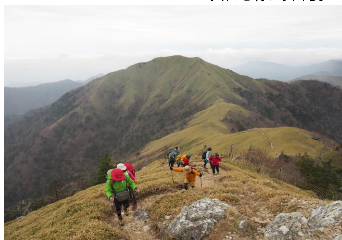
▲ 次郎笈から剣山頂へ